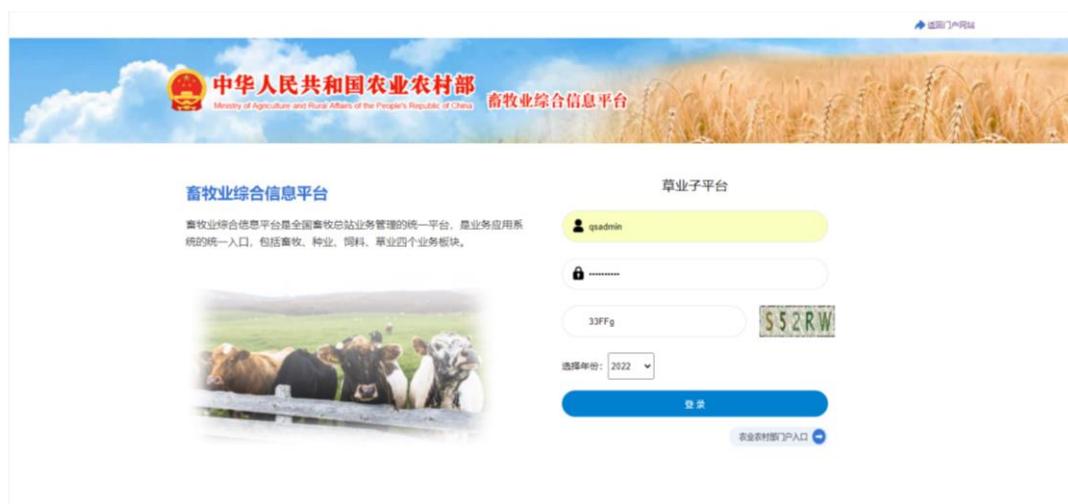
“畜牧业综合信息平台—草原子平台”主页

二、点击登录栏“注册”按钮，进行用户注册（注册界面见图 2）。带“*”的红色栏目必填，其中“用户角色设置”栏应选择“公众用户-区试申请和品种审定”。