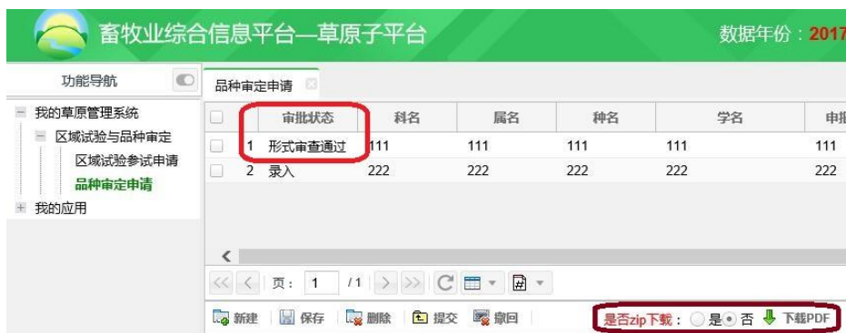
图 6 审批状态显示示意图

九、形式审查未通过被退回的申请，可点击 查看形式审查未通过意见 按钮，按照系统提示的退回理由进行修改完善后再次提交；超过申请截至时限后，审批状态为“录入”的申请将无法提交。